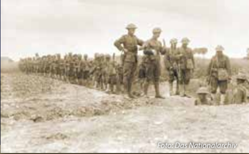
Soldaten der 119. Infanterie, 30. Division, steigen in die Schützengräben bei Watou, Belgien.