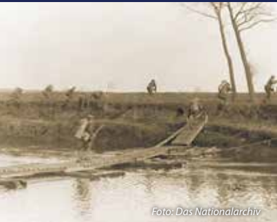
Soldaten der 146. Infanterie, 37. Division, überqueren die Schelde bei Nederzwalm unter Beschuss.

Die Toten sind in vier gleich großen rechteckigen Parzellen begraben; jede Parzelle besteht aus 92 Gräbern.