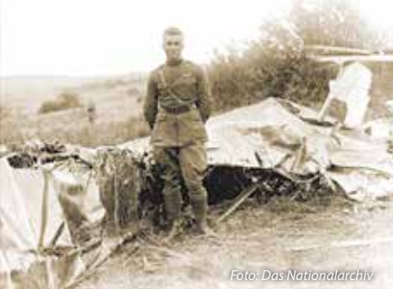
2. Lt. Frank Luke, Jr. hatte in 17 Tagen 18 deutsche Flugzeuge und Ballons abgeschossen.