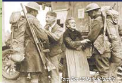
Ein französisches Paar dankt US-Soldaten für die Befreiung ihrer Stadt am 6. November 1918.

Davidsterne markieren jüdische Gräber und lateinische Kreuze alle andern. Grabsteine von Soldaten, die mit der Medal of Honor ausgezeichnet wurden, sind mit Gold eingraviert.