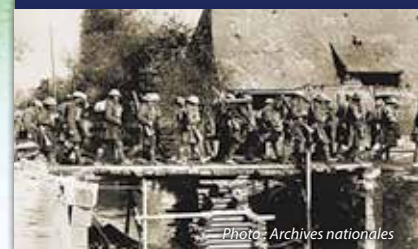
Soldats de la 27 ème Division empruntant un pont provisoire à Saint-Souplet, 19 octobre 1918.