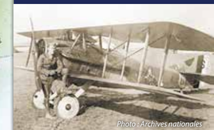
Le lieutenant E. V. Rickenbacker, de la 94 ème Escadrille aéroportée "Hat in the Ring", après la campagne de Saint-Mihiel.

L'aigle sculpté qui s'élève au centre du cimetière est un cadran solaire. Sur son socle est gravée la célèbre phrase du Général Pershing : « Le temps ne ternira pas la gloire de leurs actions. »