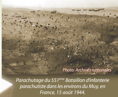
Parachutage du 551 ème Bataillon d'infanterie parachutiste dans les environs du Muy, en France, 15 août 1944.

Le cimetière se divise en quatre parcelles disposées autour d'un bassin de forme ovale. Parmi les 860 pierres tombales, des oliviers confèrent au lieu une atmosphère paisible.