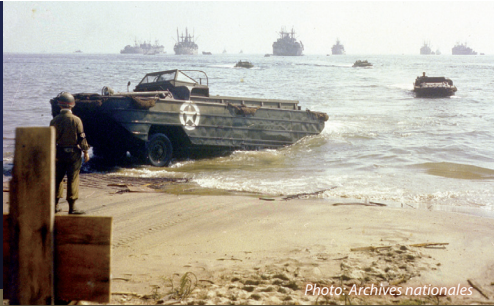
Des camions amphibies (DUKW) ravitaillent une plage de débarquement du sud de la France, en août 1944.