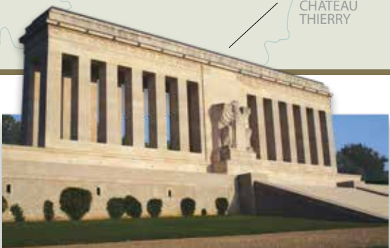
Monument commémoratif de la cote 204 (Château-Thierry) Situé sur une colline, le monument doté d'une double colonnade surplombe la ville de Château-Thierry. Une grande carte retrace la progression des forces américaines dans la région.