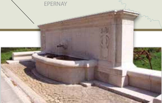
Fontaine Lieutenant Quentin Roosevelt (Chamery) Tué en combat aérien, le fils de l'ancien président américain Théodore Roosevelt avait, à l'origine, été enterré dans les environs du hameau, près du cimetière.