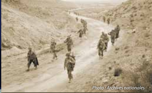
Soldats de la 1 ère Division d'infanterie traversant le col de Kasserine, 26 février 1943.

Le 8 novembre 1942, les forces britanniques et américaines du corps expéditionnaire naval allié débarquent sur les côtes d'Afrique du Nord. Les pluies hivernales et les renforts allemands bloquent leur avancée vers l'est. Les combats acharnés livrés entre février et début mai 1943 mèneront à la victoire finale en Tunisie.