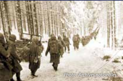
Soldats américains avançant pour couper l'accès entre Saint-Vith et Houffalize, en Belgique.

La statue de bronze de l'Ange de la Paix tient à la main un rameau d'olivier ; il veille sur tous ces héros morts et recommande leur âme au Tout-Puissant.