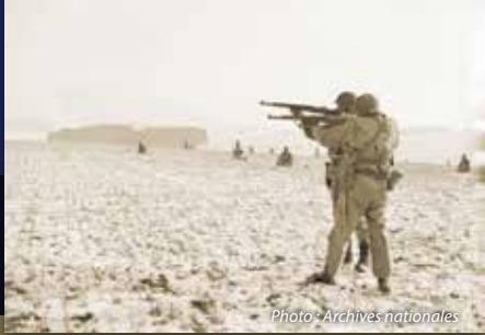
Soldats américains tirant sur les forces allemandes qui encerclent Bastogne.

L'obélisque de Butgenbach (Büllingen) en Belgique commémore le sacrifice des 458 soldats de la 1 ère Division d'infanterie (la « Big Red One ») tombés entre le 16 décembre 1944 et le 7 février 1945.