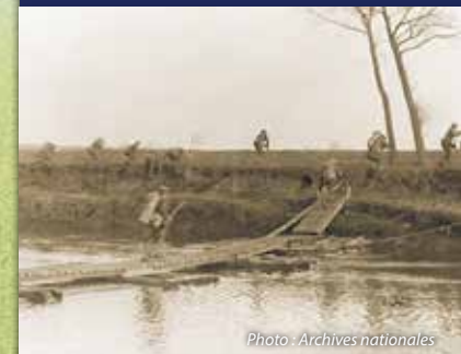
Soldats du 146 ème régiment d'infanterie, 37 ème Division, traversant l'Escaut à Nederzwalm sous les tirs ennemis.

Les défunts sont inhumés dans quatre parcelles rectangulaires identiques, contenant chacune 92 tombes.