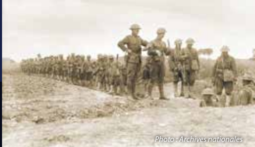
Des soldats du 119 ème régiment d'infanterie, 30 ème Division descendent dans des tranchées à Watou, en Belgique. 9 juillet 1918.