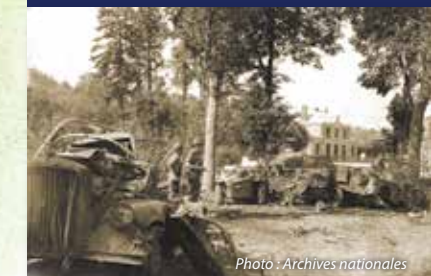
Les soldats américains bloquent l'offensive allemande près de Mortain

A l'extrémité Est du Mémorial se trouve une statue représentant "Le triomphe de la Jeunesse sur le Mal" réalisée en calcaire de Chauvigny.